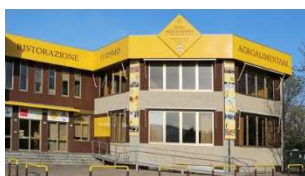
Sede di ALBA (CN) Corso Barolo, 8