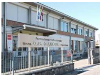
Sede Mons. G.B. Gianolio ALBA (CN)