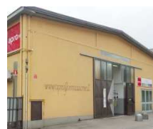
Sede di CANELLI (AT) Via dei Prati, 16

Per informazioni e iscrizioni rivolgersi agli Uffici Accoglienza presso: